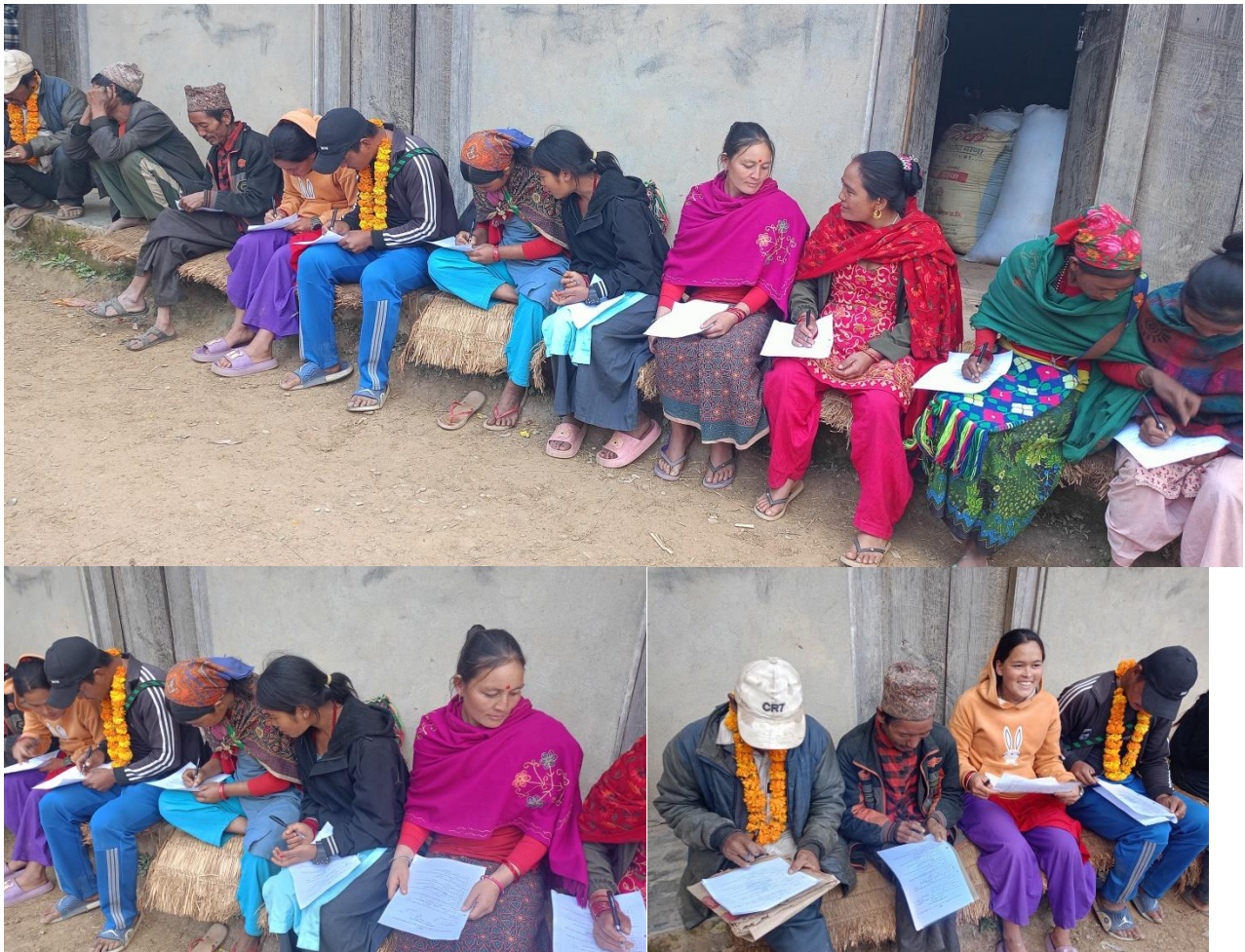
सुनिलस्मृति गाउँपालिका ढ फुलधारामा नागरिक प्रतिवेदन र निर्गम अभिमत संकलनको समयमा लिइएको तस्बिर :